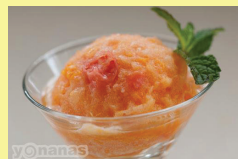
Slika 2. Prikaz menija koji je prilagođen osobama s invaliditetom