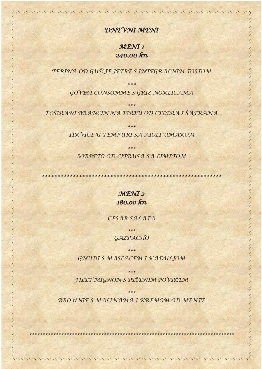
Slika 1. Prikaz menija koji nije prilagođen osobama s invaliditetom